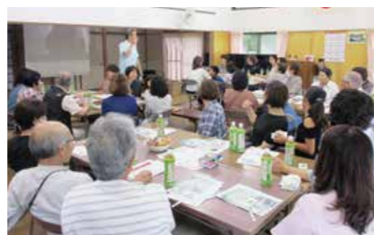
地域で開催した研修会の様子

また、本町では各町内会を単位とした自主防災組織が全町内会で組織されており今後も、各町内会と連携を図り災害ボランティア研修会の開催など「ともに助け合う地域づくり」に取り組めます。