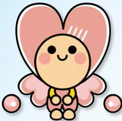
長崎県内社協 マスコットキャラクター「いこいちゃん」