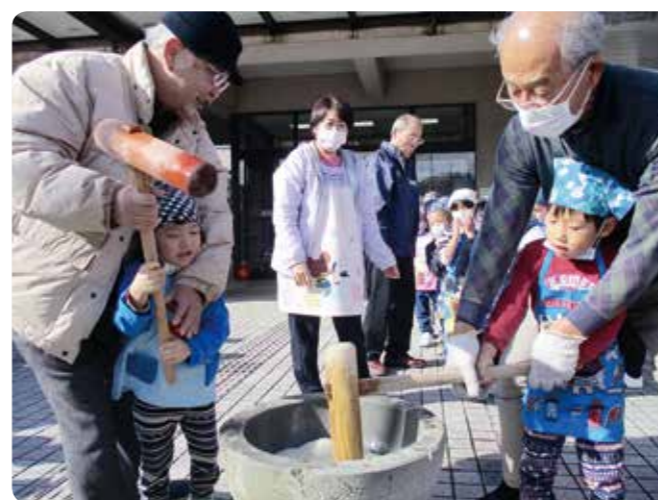
「福祉もちつき大会」の様子

令和2年、新型コロナウイルス感染症の流行により国から持続可能な「新しい生活様式」が示されました。