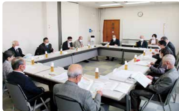
策定委員会の様子