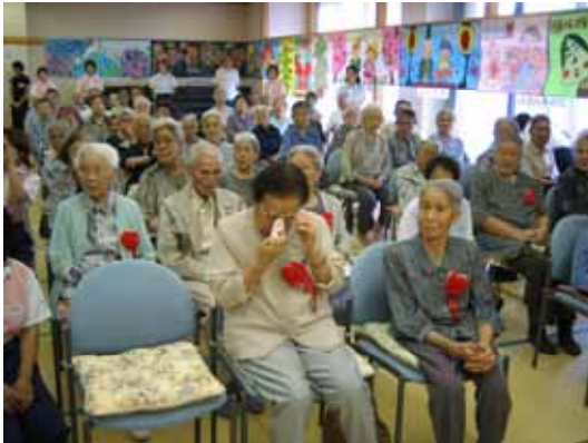
うれし泣きは、長寿の秘訣です。