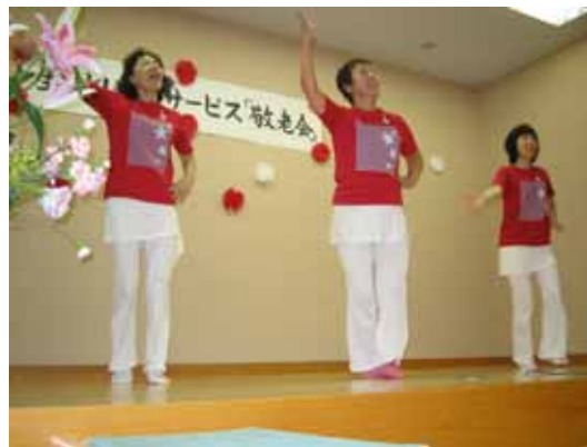
利用者の皆さんも「3B体操」をだいぶマスターしました。