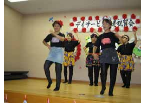
恒例の職員のダンス