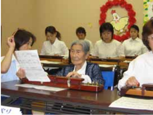
利用者と職員の合同演奏！！ 日頃の練習の成果を十分に発揮しました。