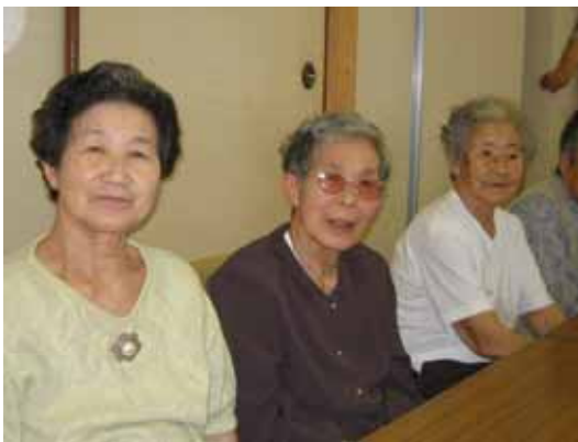
みなさん笑顔が一番です。