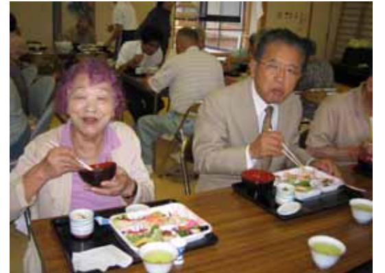
昼食風景（敬老祝賀会特別メニュー）