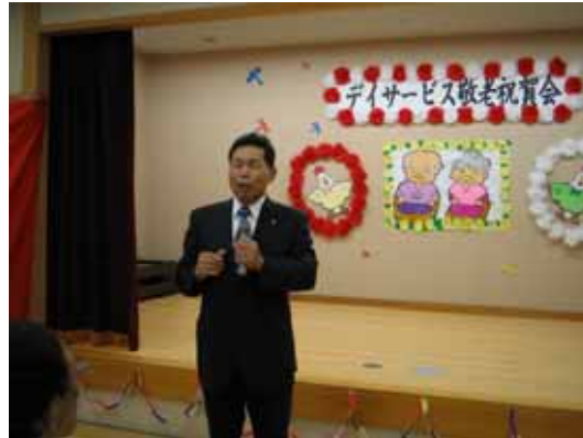
関町長から元気の出るごあいさつをいただきました。