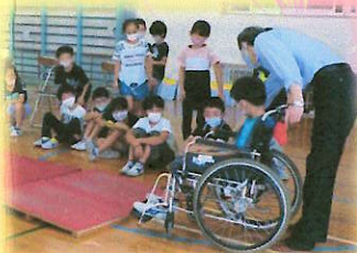
車いす体験 (貸出用車いす)

今年も、町内会を通じて募金のお願いをしております。皆様のご理解とご協力をお願い申し上げます。