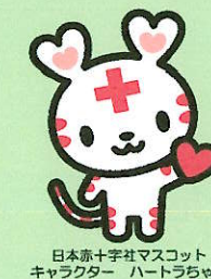
日本赤十字社マスコット キャラクター ハートラちゃん