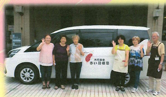
佐々町福祉センター利用者移動支援 (赤い羽根共同募金 車両助成)