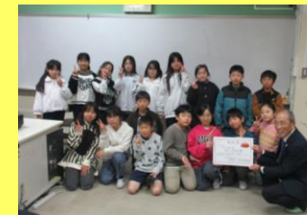
石臼小学校4年生 プロジェクトメンバー