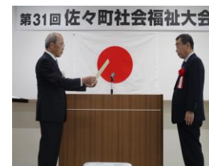
福祉功労者へ感謝状の贈呈