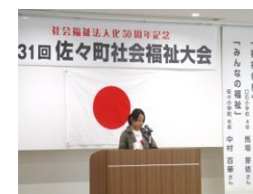
小学生による福祉意見発表