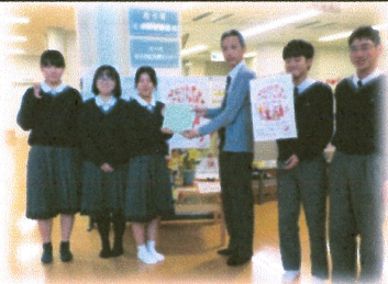
清峰高校JRC部 募金協力～記念撮影～