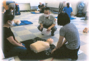
「普通救命講習Ⅰ」 心肺蘇生法・AED